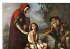
EPISODI DI STORIA DELLA LETTERATURA E DELL'ARTE