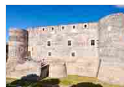
MUSEO CIVICO "CASTELLO URSINO"